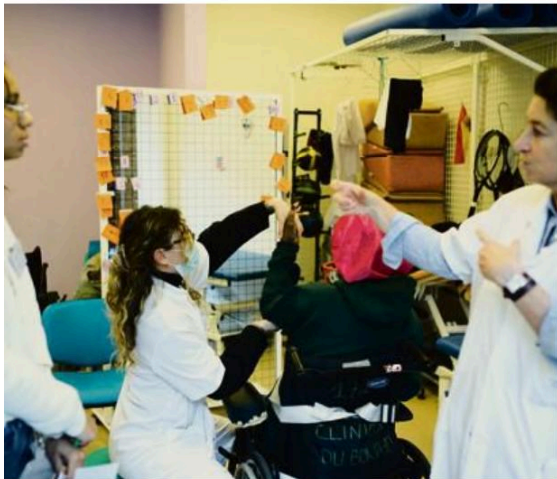
Les lycéens interrogent leurs idées reçues sur la clinique.